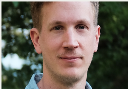
Prof. Alexandre Bovet Membre de la Digital Society Initiative, Université de Zurich

1 er mars 2024, 12.00–13.30, 2 rue de l'Hôtel-de-Ville, salle des Fiefs